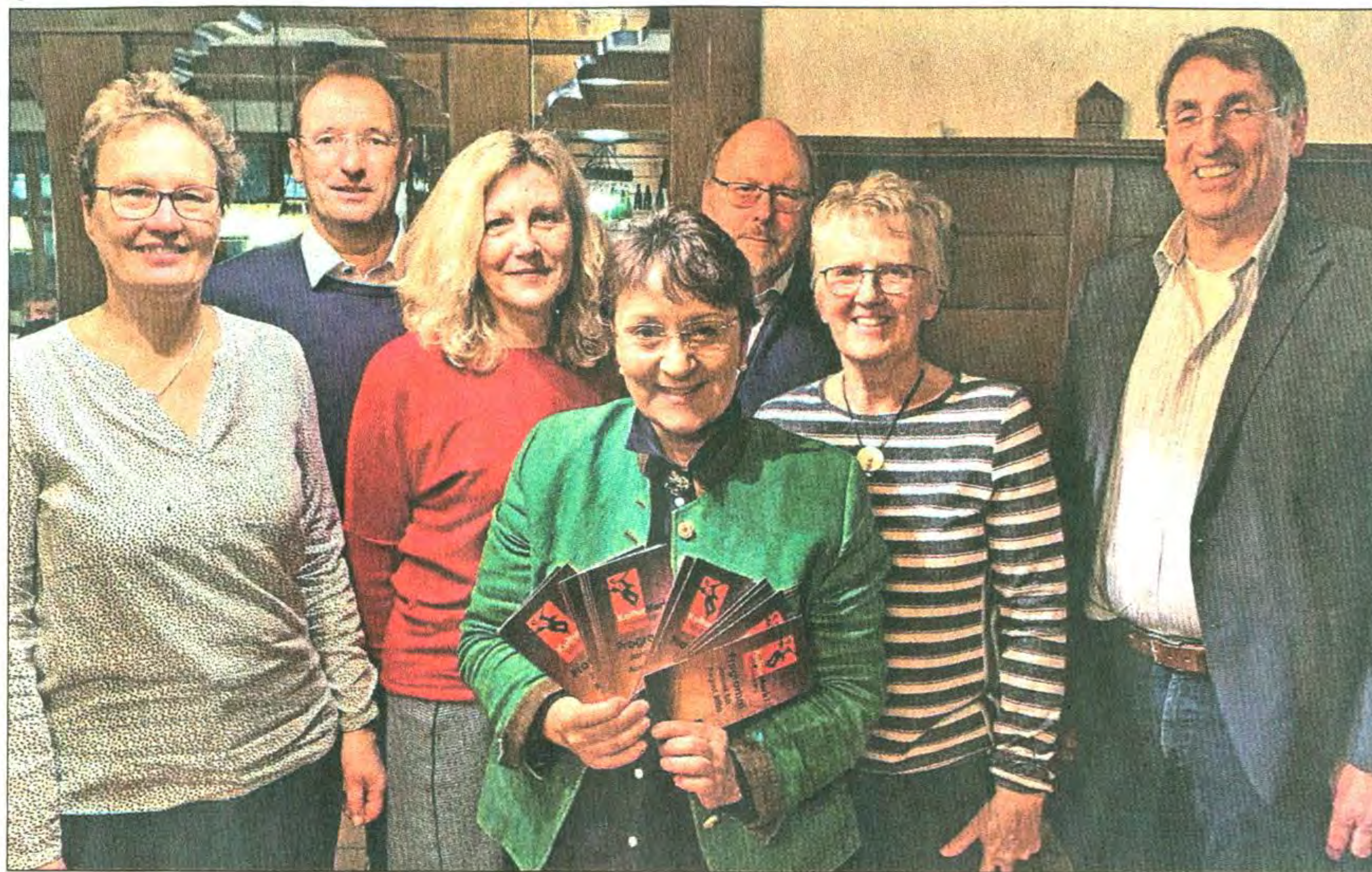
Die Vorstandschaft des KulturMarkts.