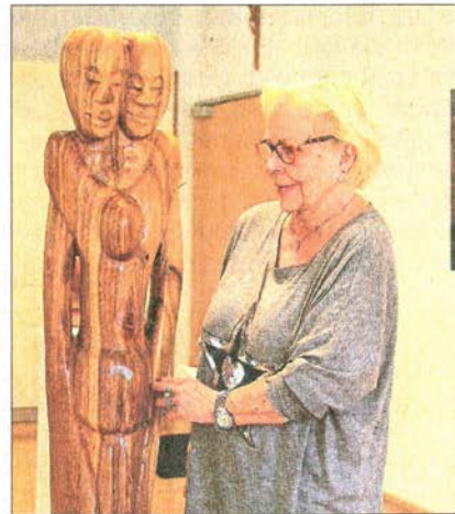
Die Bildhauerarbeiten und Gemälde fanden große Beachtung.